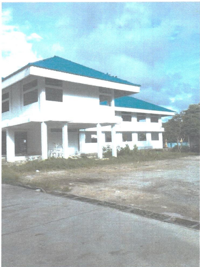
- ภาพการก่อสร้างที่ว่าการอำเภอ และศาลาประชาคม อำเภอตะกั่วทุ่ง จังหวัดพังงา