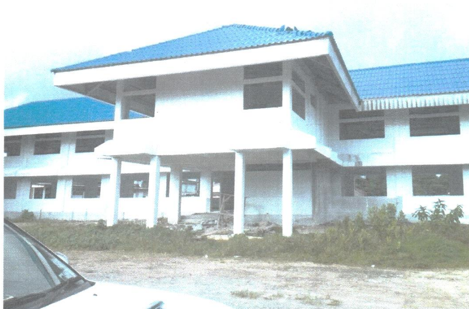
- ภาพการก่อสร้างที่ว่าการอำเภอ และศาลาประชาคม อำเภอตะกั่วทุ่ง จังหวัดพังงา