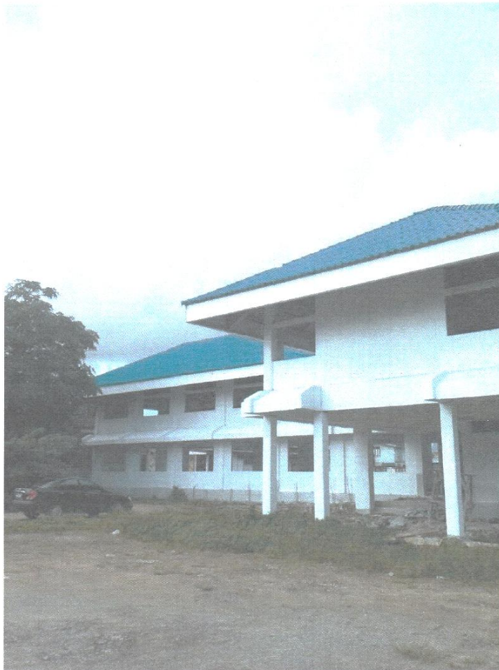
- ภาพการก่อสร้างที่ว่าการอำเภอ และศาลาประชาคม อำเภอตะกั่วทุ่ง จังหวัดพังงา