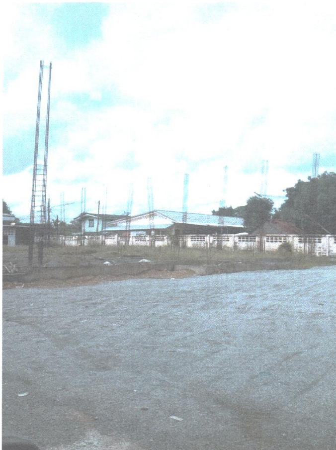
- ภาพการก่อสร้างที่ว่าการอำเภอ และศาลาประชาคม อำเภอตะกั่วทุ่ง จังหวัดพังงา